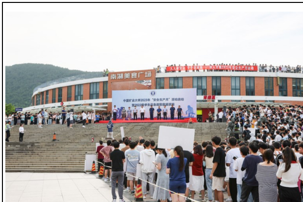
应急疏散演练活动现场

主题团日活动，介绍“安全生产月”的相关背景知识，观看安全知识科普微电影。学生党员工作站、本科生第一党支部、本科生第二党支部联合开展校园安全大检查活动。学院积极 2023 年“安全生产月”活动启动暨 2022 级学生应急疏散救援演练，切实提高本单位师生员工安全意识。